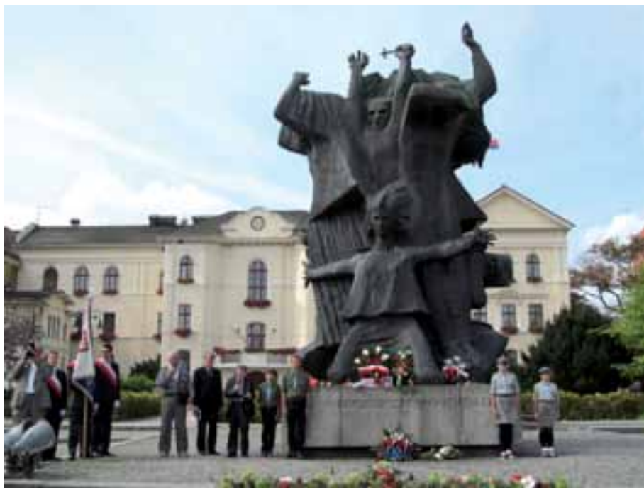
17. Uroczystość na Starym Rynku w Bydgoszczy.