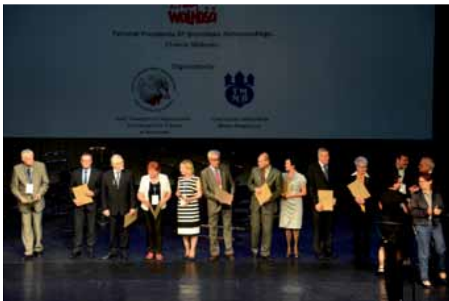
31. U honorowanie dyplomami „Za zasługi w upowszechnianiu kultury” przyznawanymi przez Ministerstwo Kultury i Dziedzictwa Narodowego.