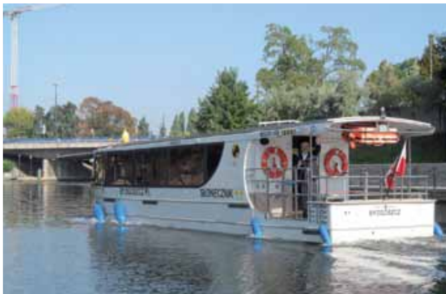
2. „Słonecznik” na trasie.