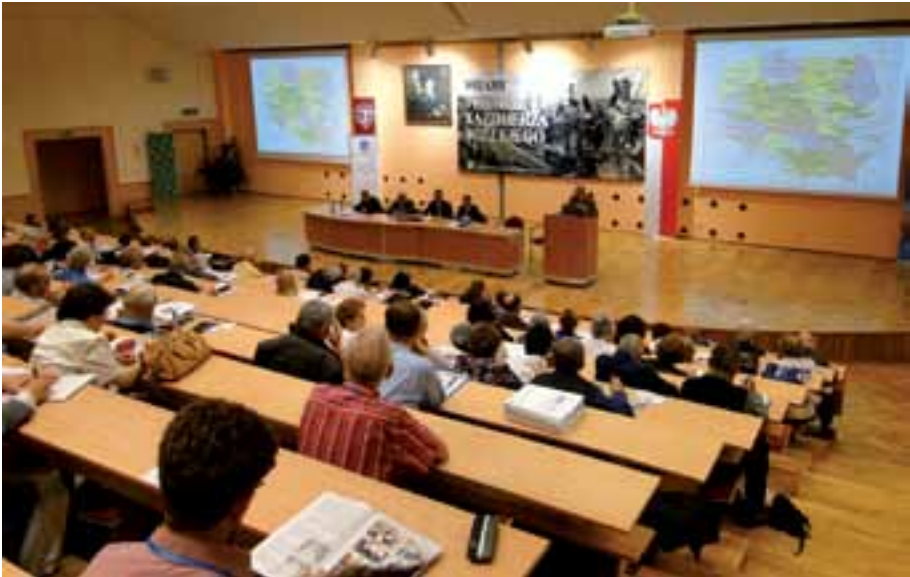
39. Fragment auli Auditorium Novum Uniwersytetu Technologiczno-Przyrodniczego im. J.J. Śniadeckich podczas Konferencji X Kongresu.