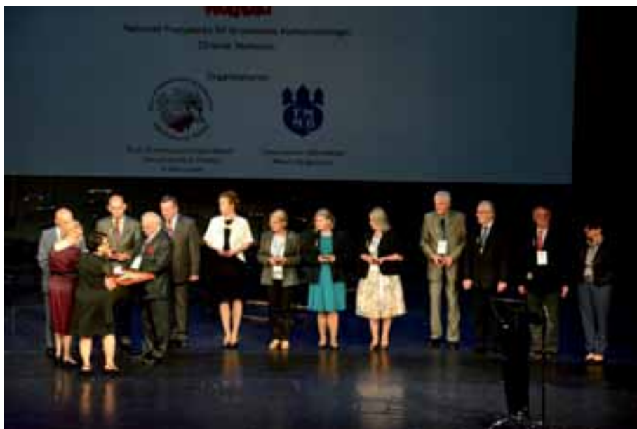
30. Wręczenie odznak honorowych „Zasłużony dla kultury polskiej”.