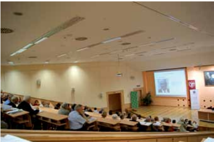
40. Obrady trwają.