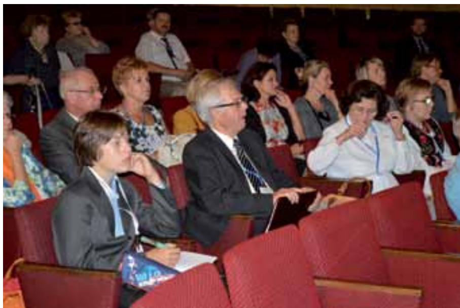
20. Fragment widowni w Pałacu Młodzieży.