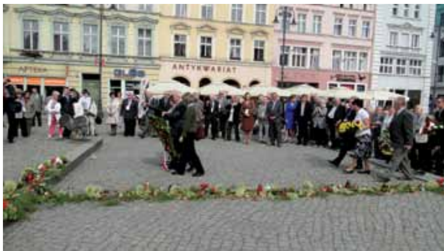
18. W 75. rocznicę wybuchu II wojny światowej uczestnicy Kongresu złożyli pod pomnikiem Walki i Męczeństwa na Starym Rynku wieńce i kwiaty. W tym miejscu na osobisty rozkaz A. Hitlera Niemcy dokonali publicznej egzekucji bydgoszczan.