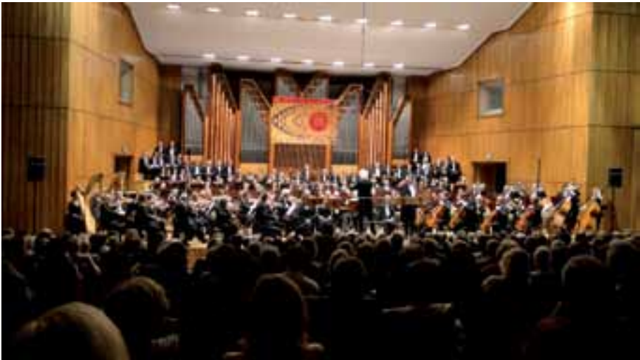
47. Wieczorem regionalistów zaproszono do Filharmonii Pomorskiej na inaugurację 52 Bydgoskiego Festiwalu Muzycznego Musica Antiqua Europae Orientalis – na koncert „Ofiarom wszystkich wojen”.