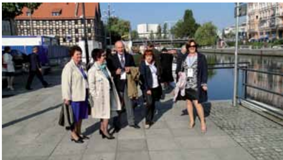
4. W sąsiedztwie spichrzów nad Brdą.