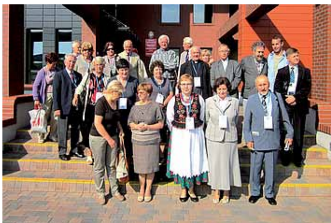
9. W trakcie zwiedzania Biblioteki Uniwersytetu Kazimierza Wielkiego w Bydgoszczy.