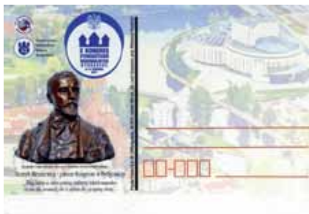
Kartka pocztowa X Kongresu z podobizną patrona H. Sienkiewicza.