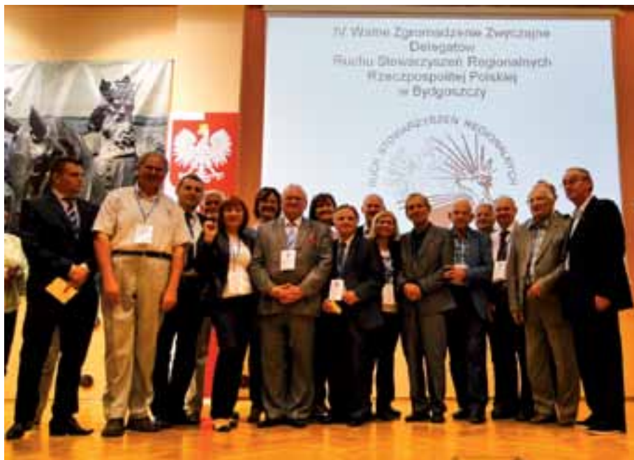
52. Pamiątkowe zdjęcie na podium Konferencji z przedstawicielami Towarzystwa Karkonoskiego z Jeleniej Góry.