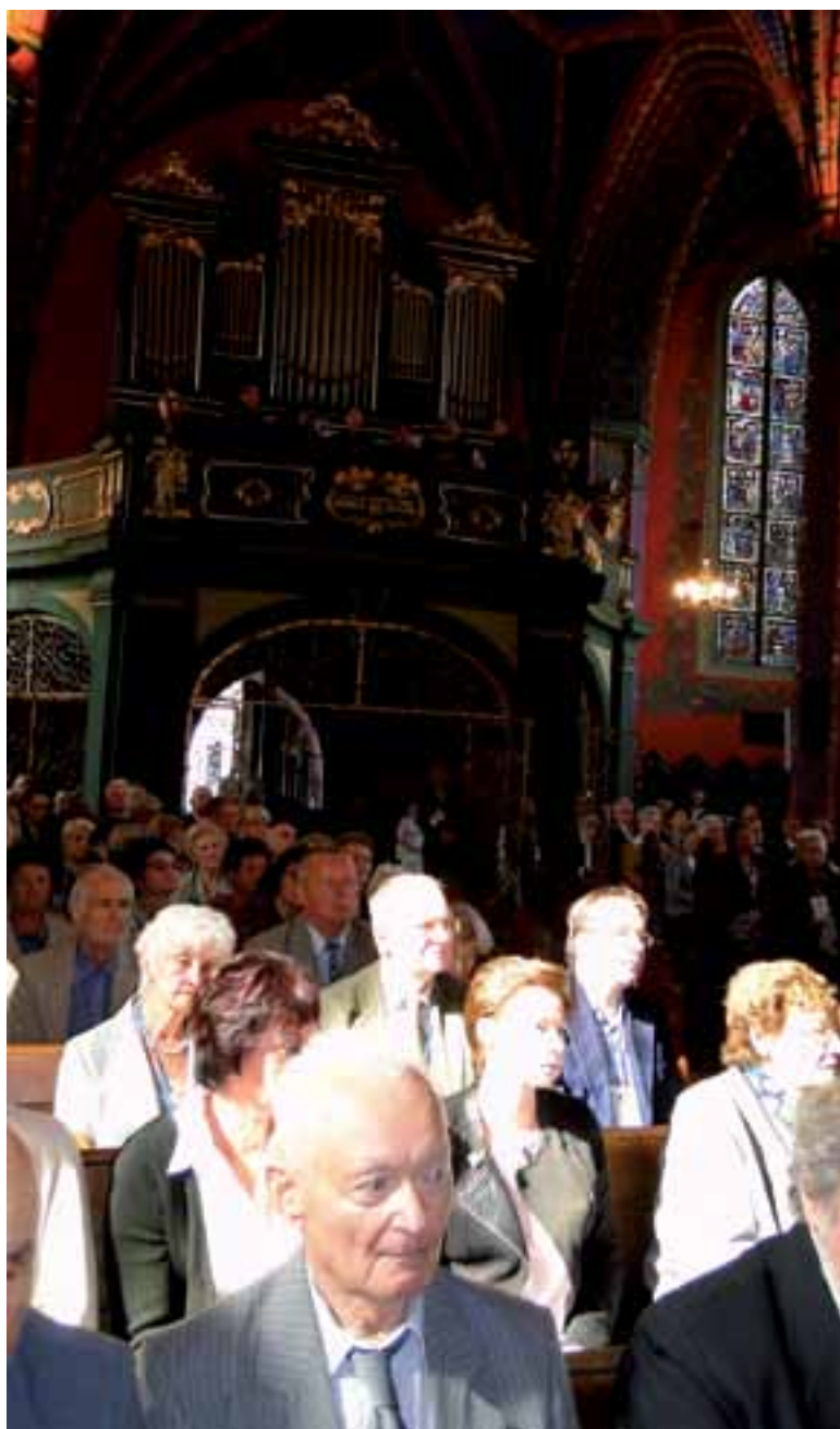
14. Msza Święta w intencji polskich regionalistów w bydgoskiej Katedrze.