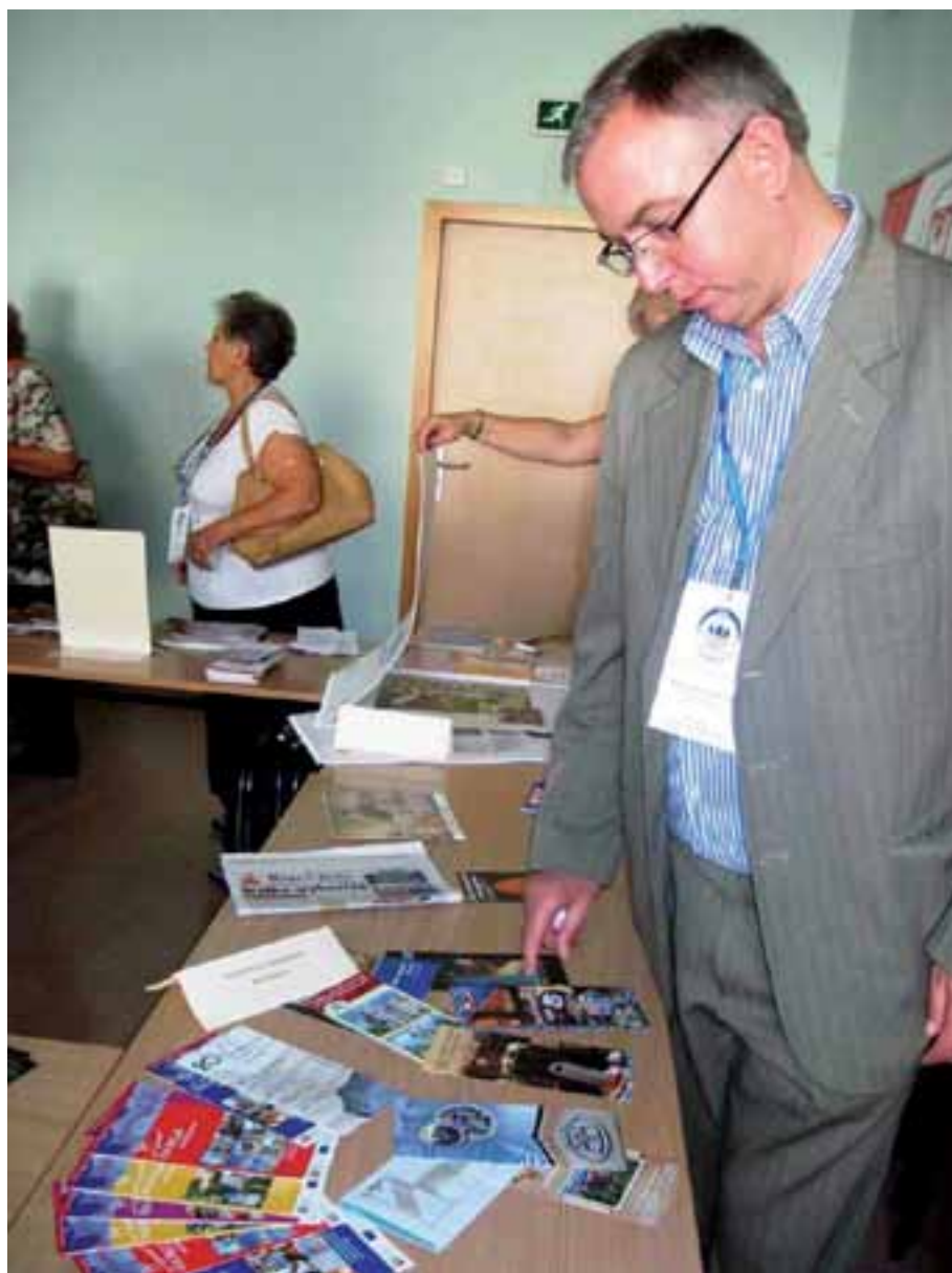
36. Fragment ekspozycji.