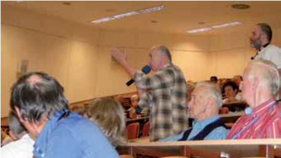
43. Padały głosy w dyskusji prosto z sali.