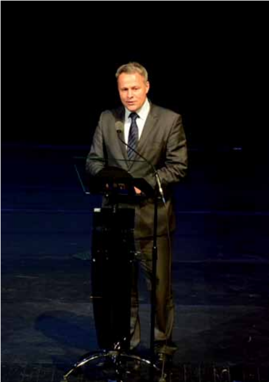
29. W imieniu gospodarzy Kongresu, gości powitał prezydent Bydgoszczy Rafał Bruski.