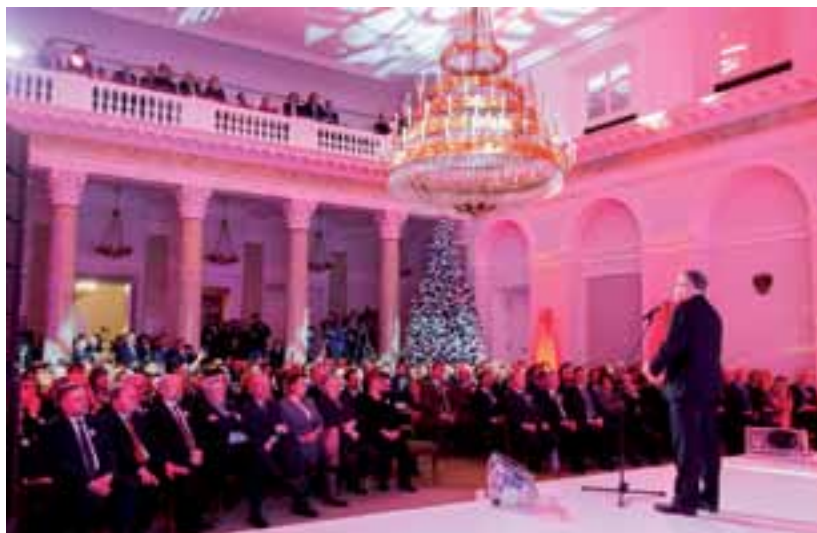
1. Dziękuję z całego serca – powiedział do uczestników spotkania podsumowującego obchody 25-lecia polskiej wolności Prezydent Rzeczypospolitej Polskiej Bronisław Komorowski.