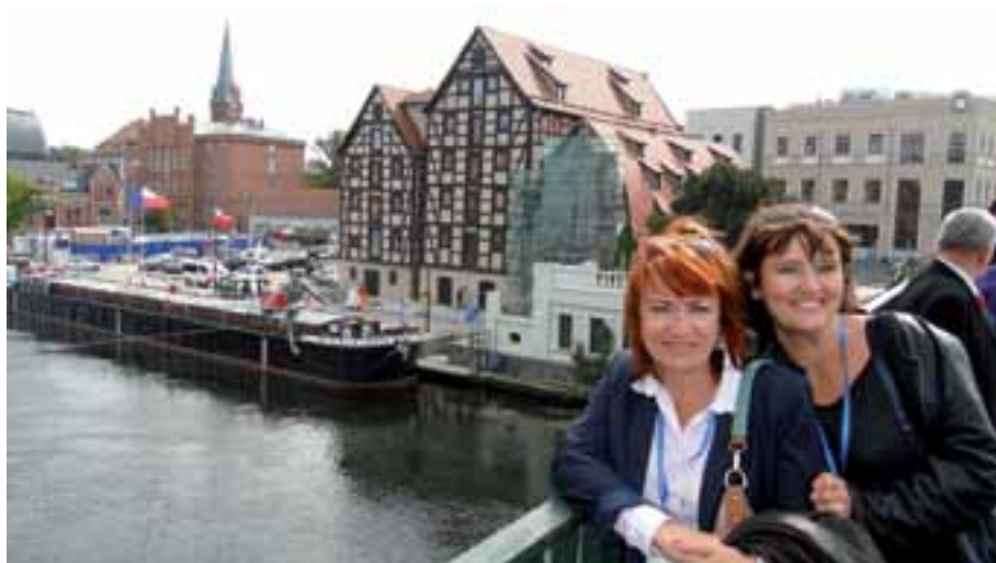
3. Bydgoszcz urzekła uczestników Kongresu.