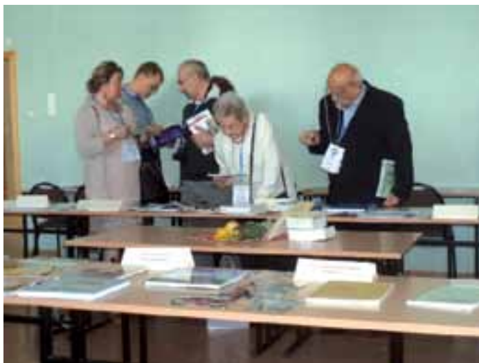
37. Ekspozycja Kujawsko-Pomorskiej Izby Rzemiosła i Przedsiębiorczości w Bydgoszczy.