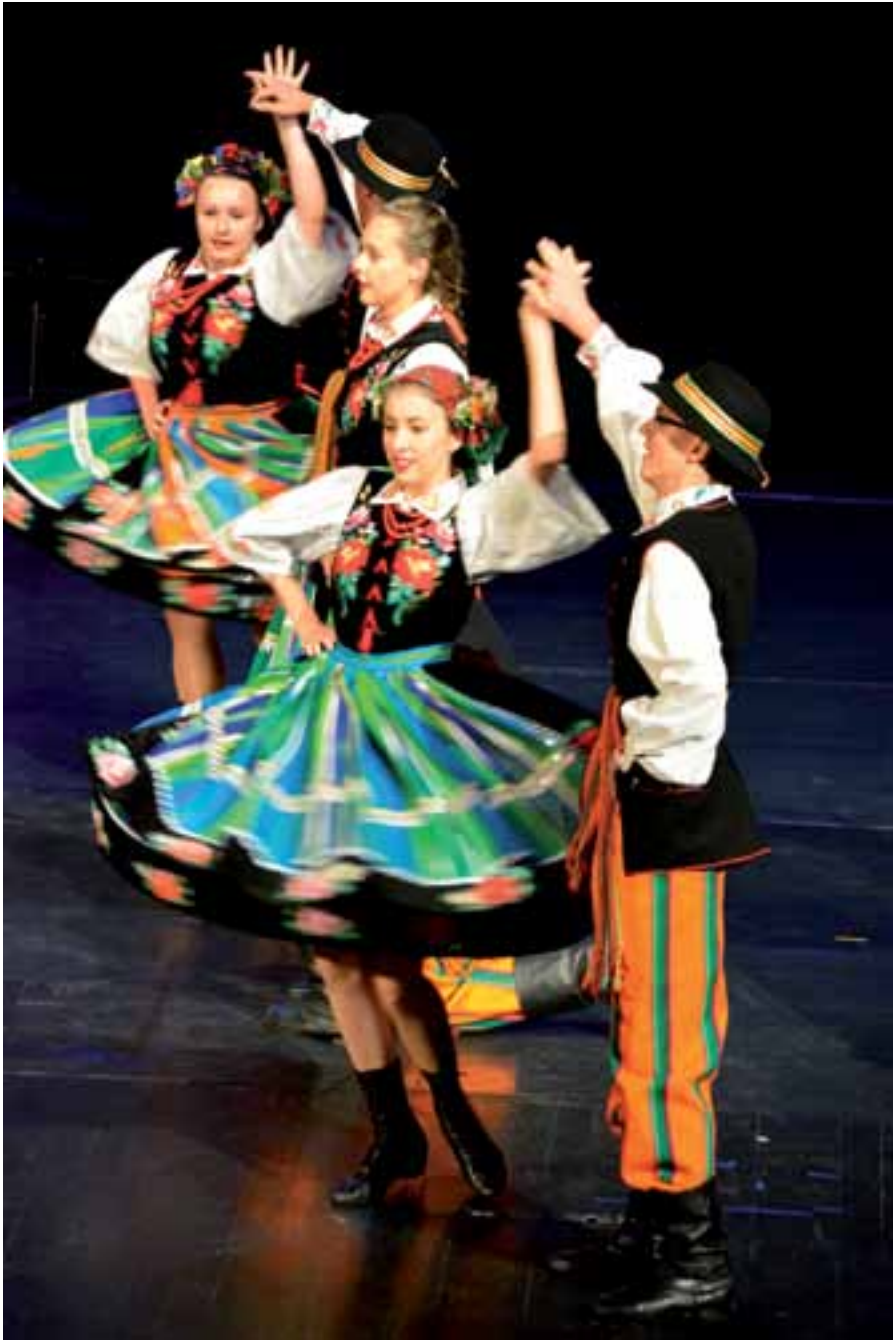
26. „Płomienie” urzekły naszych gości.