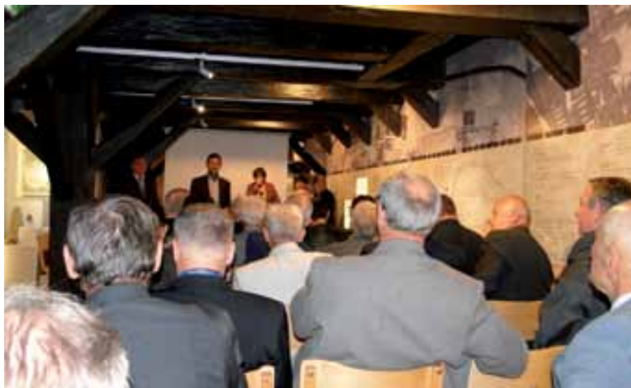
21. W zabytkowym spichrzu przy ul. Grodzkiej prezentacja poświęcona muzealnemu potencjałowi wiedzy o regionie.