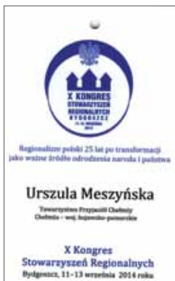
Strona główna Identyfikatora uczestnika Kongresu.