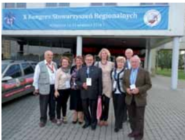
55. Pamiątkowe zdjęcie działaczy Towarzystwa Przyjaciół Rogoźna przed aulą Auditorium Novum Uniwersytetu Technologiczno-Przyrodniczego im. J.J. Śniadeckich w Bydgoszczy.