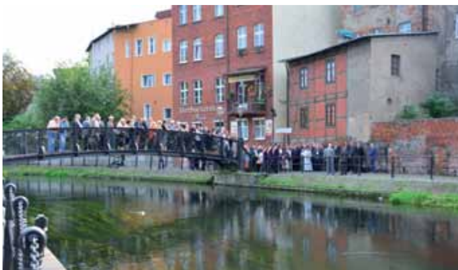
11. Widok ogólny nabrzeża Towarzystwa Miłośników Miasta Bydgoszczy przy rwącej Brdzie Młynówce.