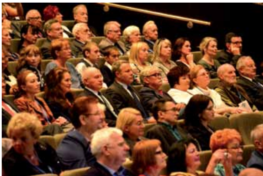
28. Fragment widowni w Operze Nova.