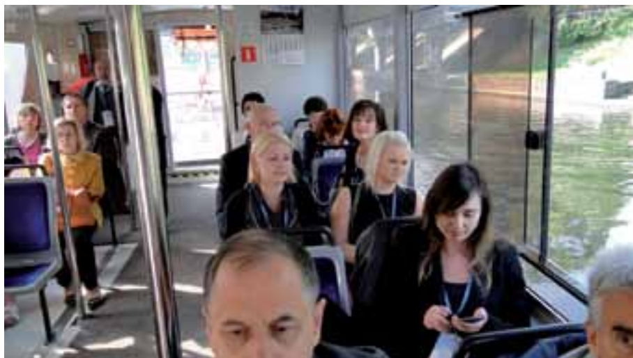
1. Niewątpliwą atrakcją była wycieczka stateczkiem „Słonecznik” po Brdzie i Kanale Bydgoskim”.

Zdjęcia przedstawiają wydarzenia X Kongresu Stowarzyszeń Regionalnych w Bydgoszczy w układzie chronologicznym.