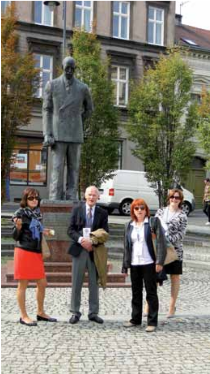
5. Pod pomnikiem Leona Barciszewskiego, prezydenta Bydgoszczy zamordowanego przez Niemców w 1939 roku.