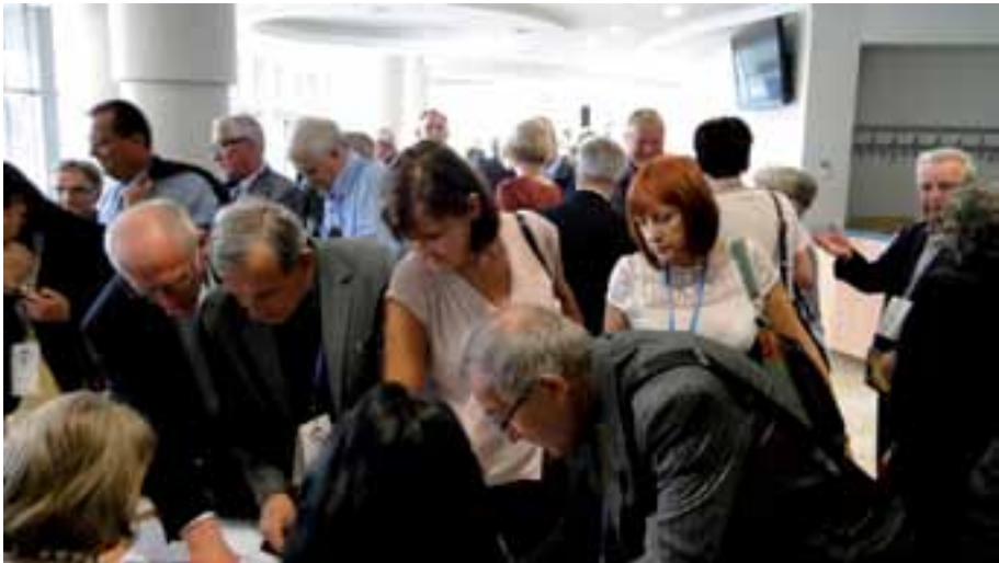
50. Przed Walnym Zgromadzeniem.