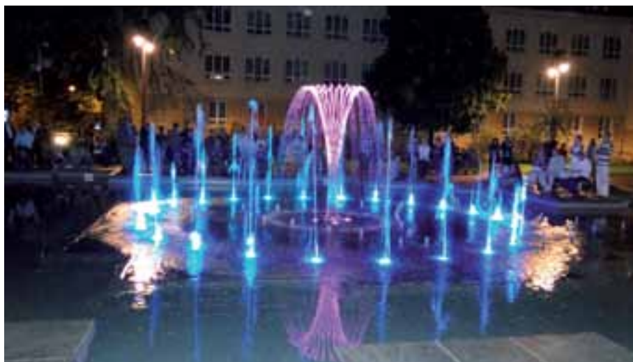
48. Po koncercie – widowisko „Woda, światło, dźwięk” przy fontannie „Kolorowy strumień wody” i tak potrzebny relaks.