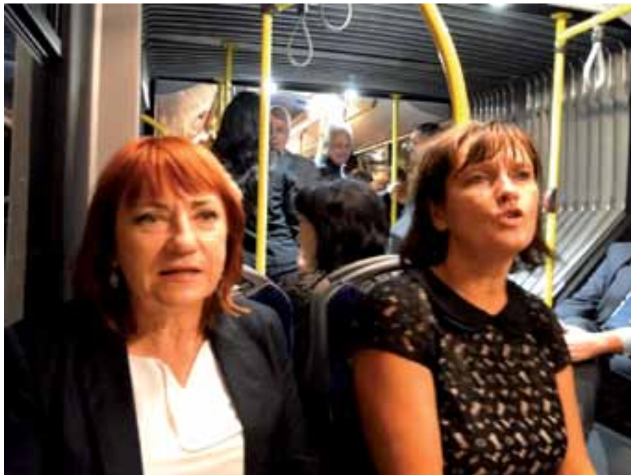
49. Późnym wieczorem autokarowy powrót do Domu Studenta UTP.