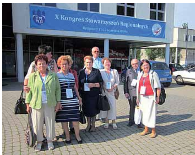
56. Delegaci z Wieliczki.