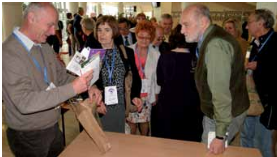
35. Wielkim zainteresowaniem cieszyły się wydawnictwa przywiezione na Kongres przez delegatów stowarzyszeń z całej Polski.