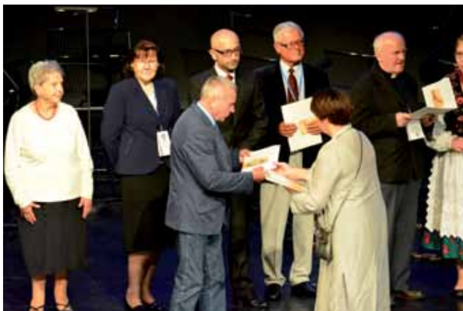
33. Wręczenie dyplomów Rady Krajowej Ruchu Stowarzyszeń Regionalnych RP.