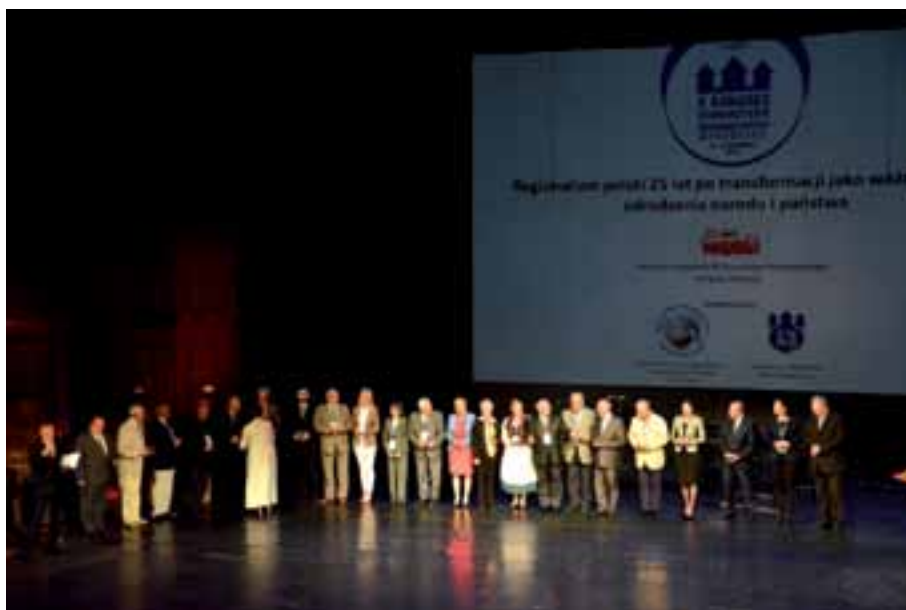
32. Dekoracja Medalami im. Aleksandra Patkowskiego.