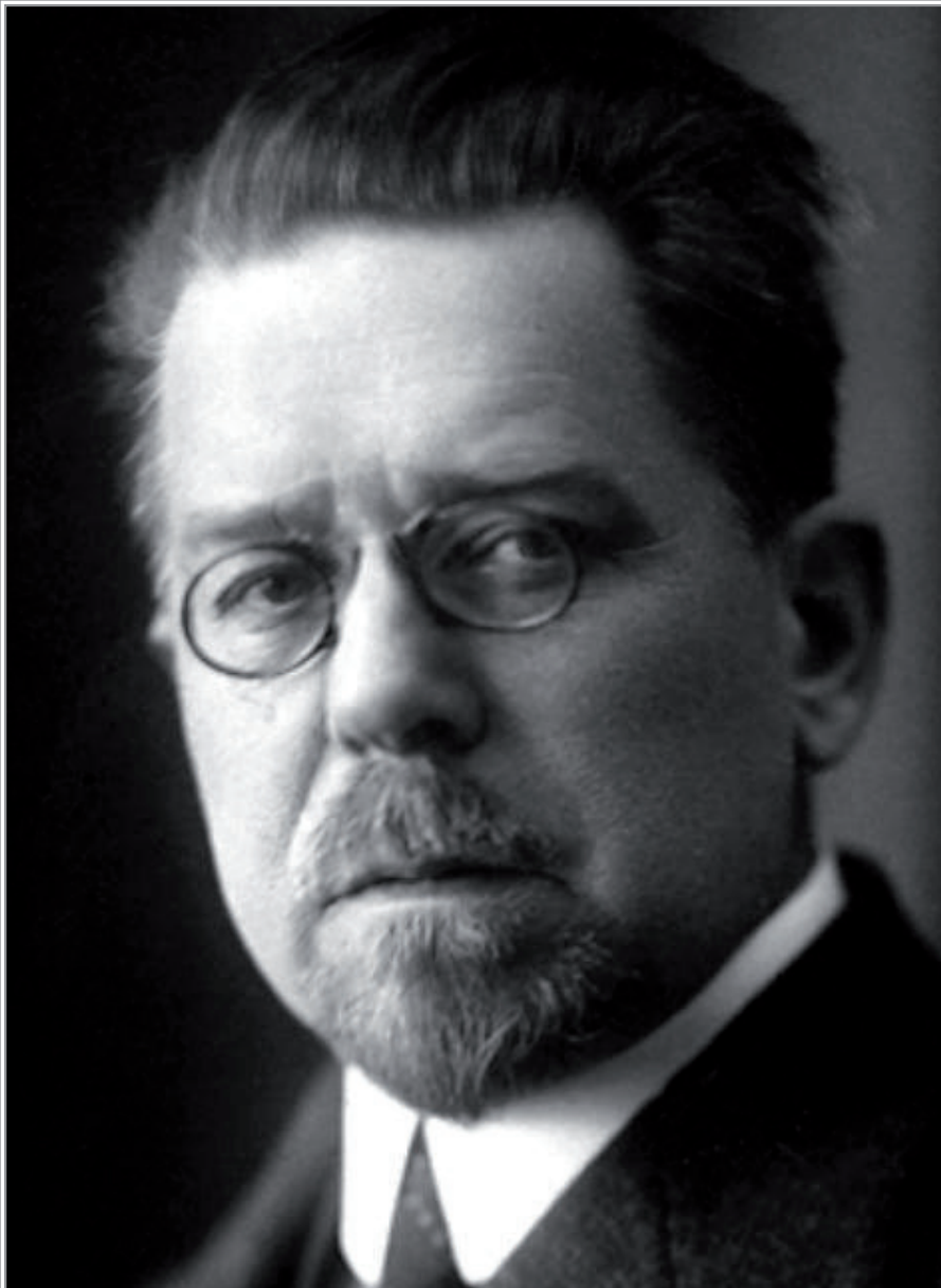
Władysław Stanisław Reymont na zdjęciu ze zbiorów Izby Pamięci W. Reymonta w Kołaczkanie.